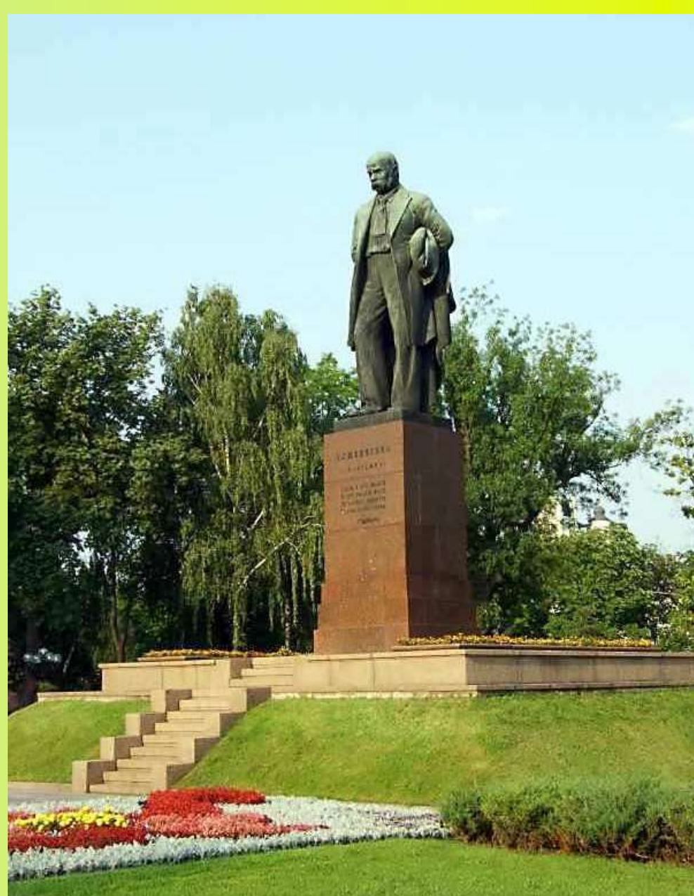
Пам'ятник Тарасу Шевченку у Києві – встановлений у 1939 році з нагоди 125-річчя з дня народження поета.

Багато пам'ятників, наприклад, у Львові чи Ялті (Крим), були відлиті у Аргентині на кошти української діаспори, що підкреслює її внесок у збереження національної пам'яті.