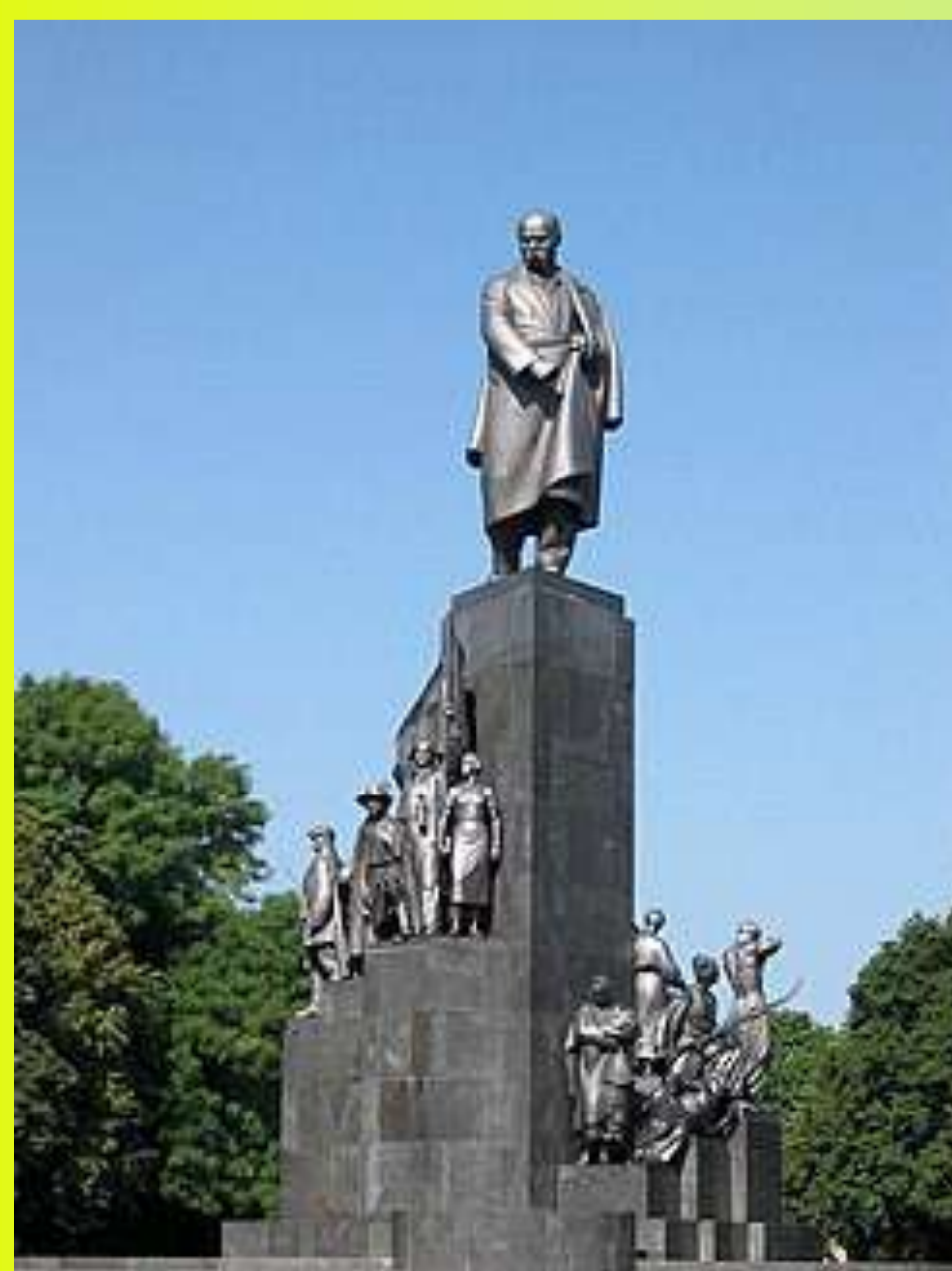
Пам'ятник Тарасу Шевченку у Харкові – встановлений у 1935 році, монумент вважається одним з найкращих пам'ятників Тарасу